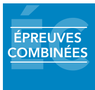
TABLE DES MATIÈRES